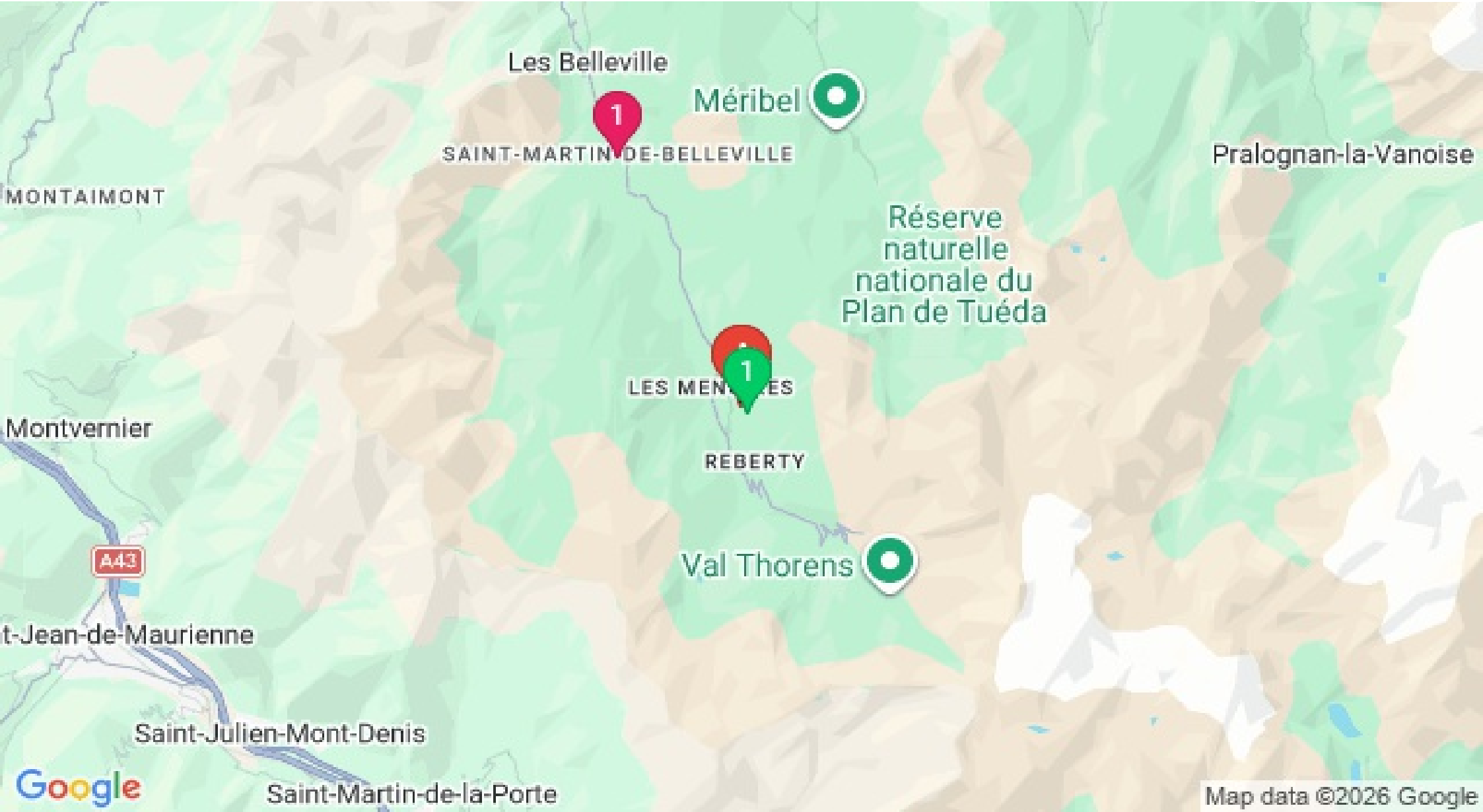
Map data ©2026 Google